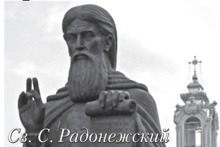
Св. С. Радонежский

КАК ДВА РАЗЛИЧНЫХ ПОЛЮСА, ВО ВСЕМ ВРАЖДЕБНЫ МЫ: ЗА СВЕТ И МИР МЫ БОРЕМСЯ, ОНИ – ЗА ЦАРСТВО ТЬМЫ.